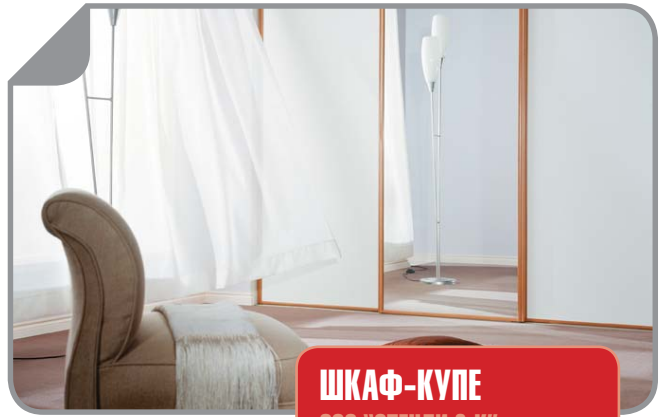
ШКАФ-КУПЕ ООО "СТЕНЛИ & К"

ул. Авиаторов, 56, оф.351 • тел. (391) 234-56-78