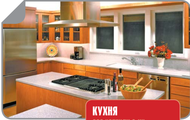
КУХНЯ ООО "СТЕНЛИ & К"

Stop agli incentivi per il mercato dell'auto. Lo ha affermato oggi il ministro dello Sviluppo, Claudio Scajola. Il Governo ha ritenuto che anche in Italia sia giunto il momento di tornare alla normalità del mercato dell'auto, non rinnovando gli incentivi e intensificando invece il sostegno alla ricerca e all'innovazione. La manovra porterà a una diminuzione delle vendite di automobili.