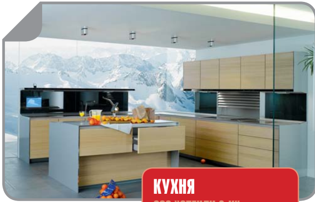
КУХНЯ ООО "СТЕНЛИ & К"

ул. Авиаторов, 56, оф.351 • тел. (391) 234-56-78